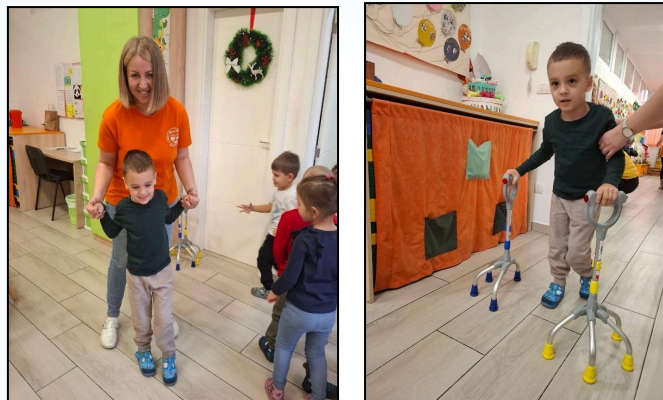
Лични пратилац и В.Ж. из „Кунг-Фу Панда 4”

Лични пратилац детета пружа одговарајућу индивидуалну подршку детету како би оно било укључено у редовно образовање, активности унутар заједнице и да успостави што већи ниво самосталности. Деци са различитим облицима инвалидитета и развојних одступања омогућен је овај вид подршке током васпитно образовног процеса, од вртића до краја средње школе.