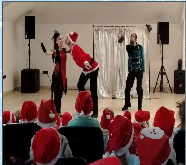
Позоришна представа: Позориште “Уна Сага Србика”