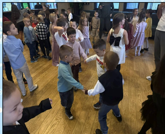
Вечерња забава у дискотеци