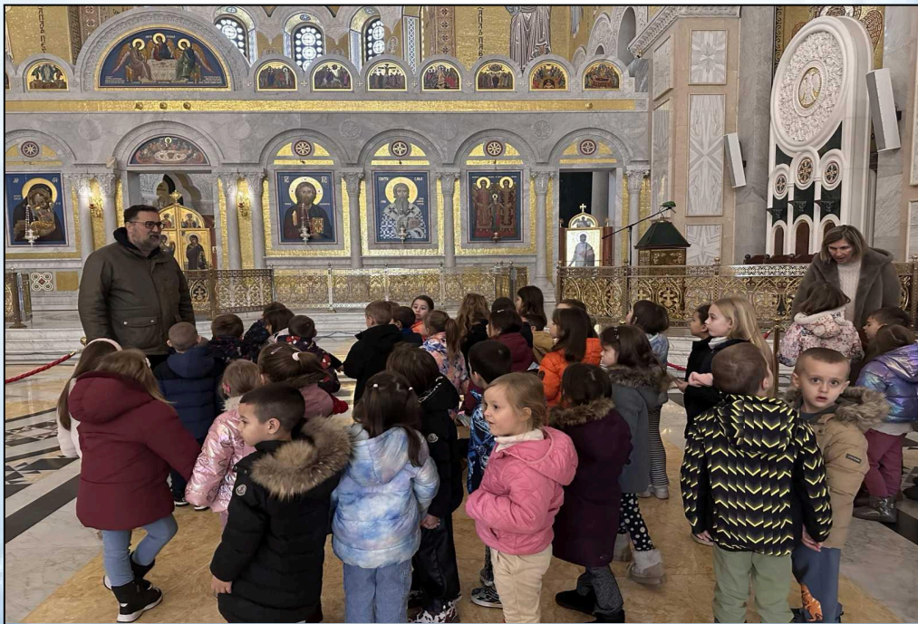
Посета предшколске и старије вртићке групе Храму Свети Сава

А овако су наши предшколци обележили Светог Саву: